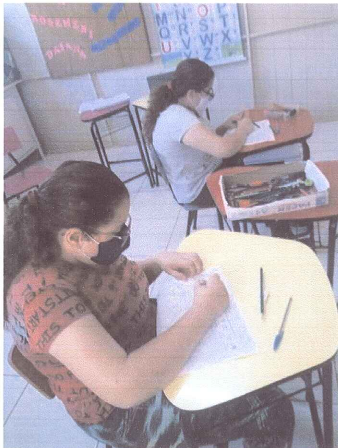
FIGURA 3 - ATENDIMENTO PEDAGÓGICO