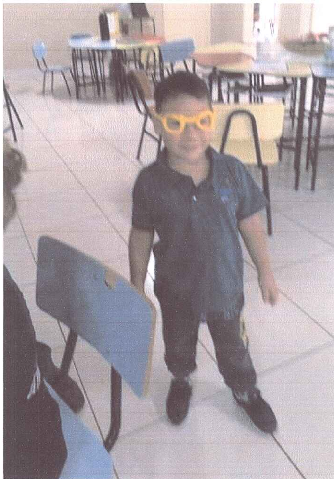
FIGURA 1 - ATENDIMENTO PEDAGÓGICO DE ALUNO DA EMEI FAVINHO DE MEL