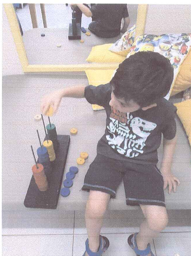
FIGURA 2 - ATENDIDO DA EMEI FAVINHO DE MEL